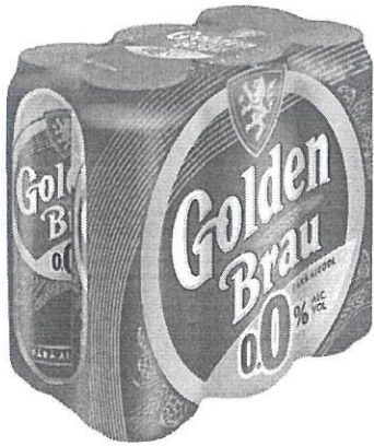
6x Can 0.5L 0.0%