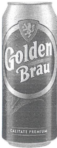
Can 0.5 L