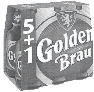
6x Sticla 0.33 L