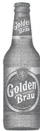
Sticla 0.33 L