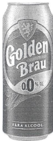
Can 0.5 L 0.0%