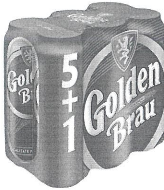
6x Can 0.5 L