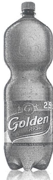
Pet 2,5 L