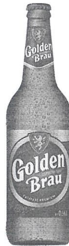
Sticla 0.66 L