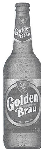
Sticla 0.66 L