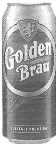
Can 0.5 L