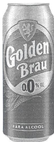
Can 0.5 L 0.0%