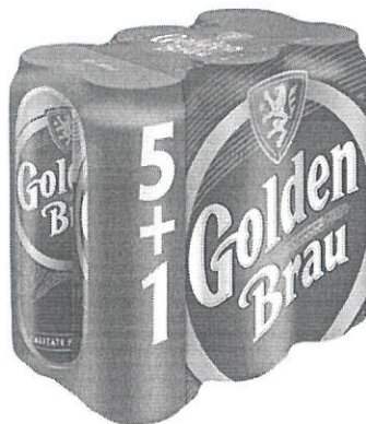
6x Can 0.5 L