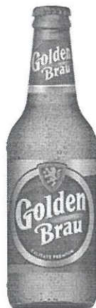
Sticla 0.33 L