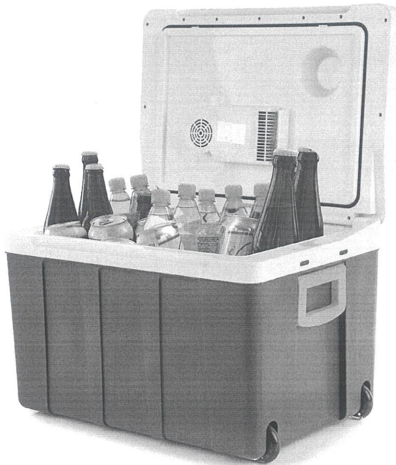
Lada frigorifica electrica Peme