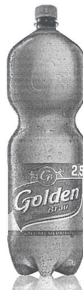
Pet 2,5 L