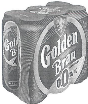
6x Can 0.5L 0.0%