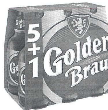
6x Sticla 0.33 L