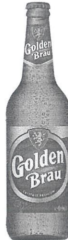
Sticla 0.66 L