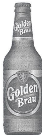
Sticla 0.33 L