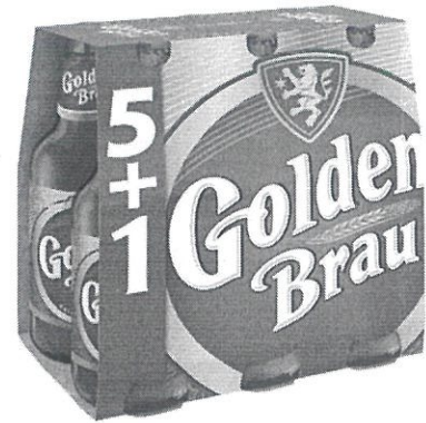
6x Sticla 0.33 L