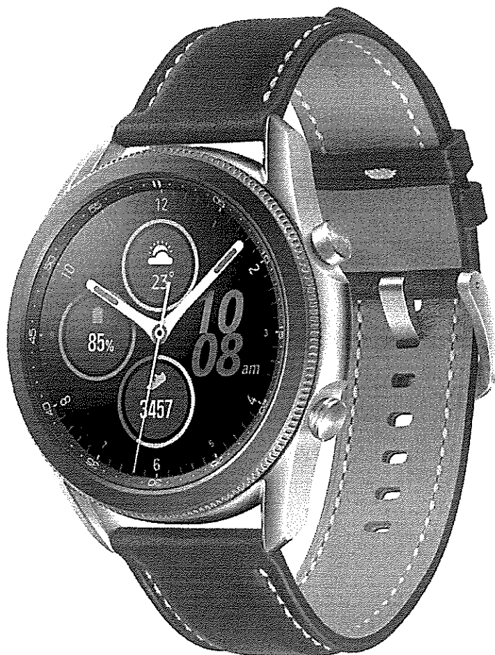
Smartwatch Samsung Galaxy Watch 3