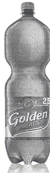
Pet 2,5 L