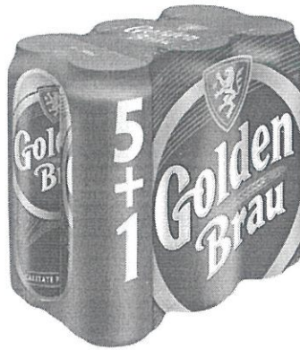
6x Can 0.5 L