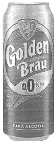
Can 0.5 L 0.0%