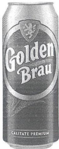
Can 0.5 L