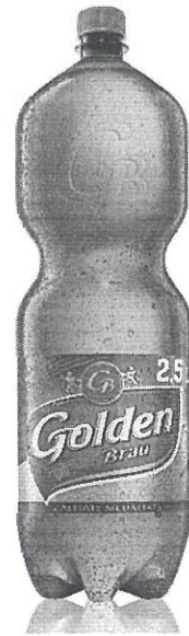
Pet 2,5 L