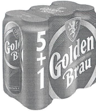
6x Can 0.5 L