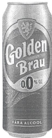
Can 0.5 L 0.0%