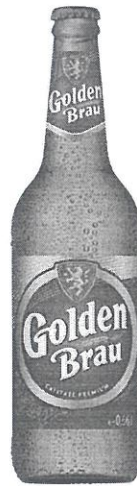
Sticla 0.66 L