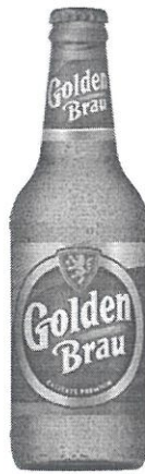
Sticla 0.33 L