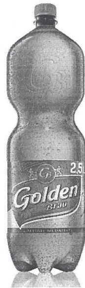
Pet 2,5 L