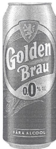
Can 0.5 L 0.0%