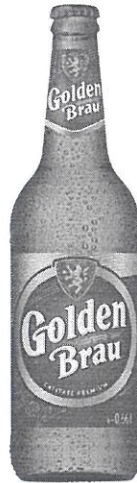
Sticla 0.66 L