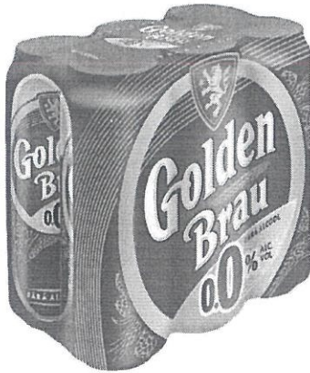
6x Can 0.5L 0.0%