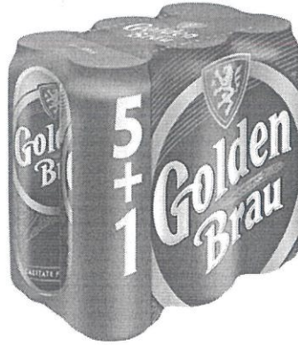
6x Can 0.5 L