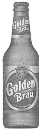
Sticla 0.33 L