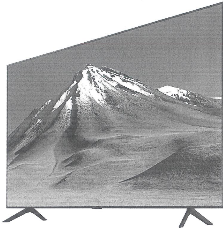
Televizor Smart LED Samsung